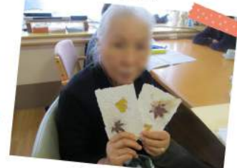
デイの新作レクは紙すき体験☆