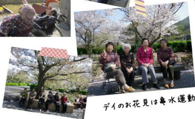
デイのお花見は奥水運動センター