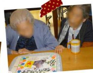
特養のお誕生日レクと おやつレクは趣向を凝らして 毎月実施しています