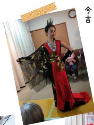
今年も来ていただきました 吉田愛服飾専門学校様によるファッションショー