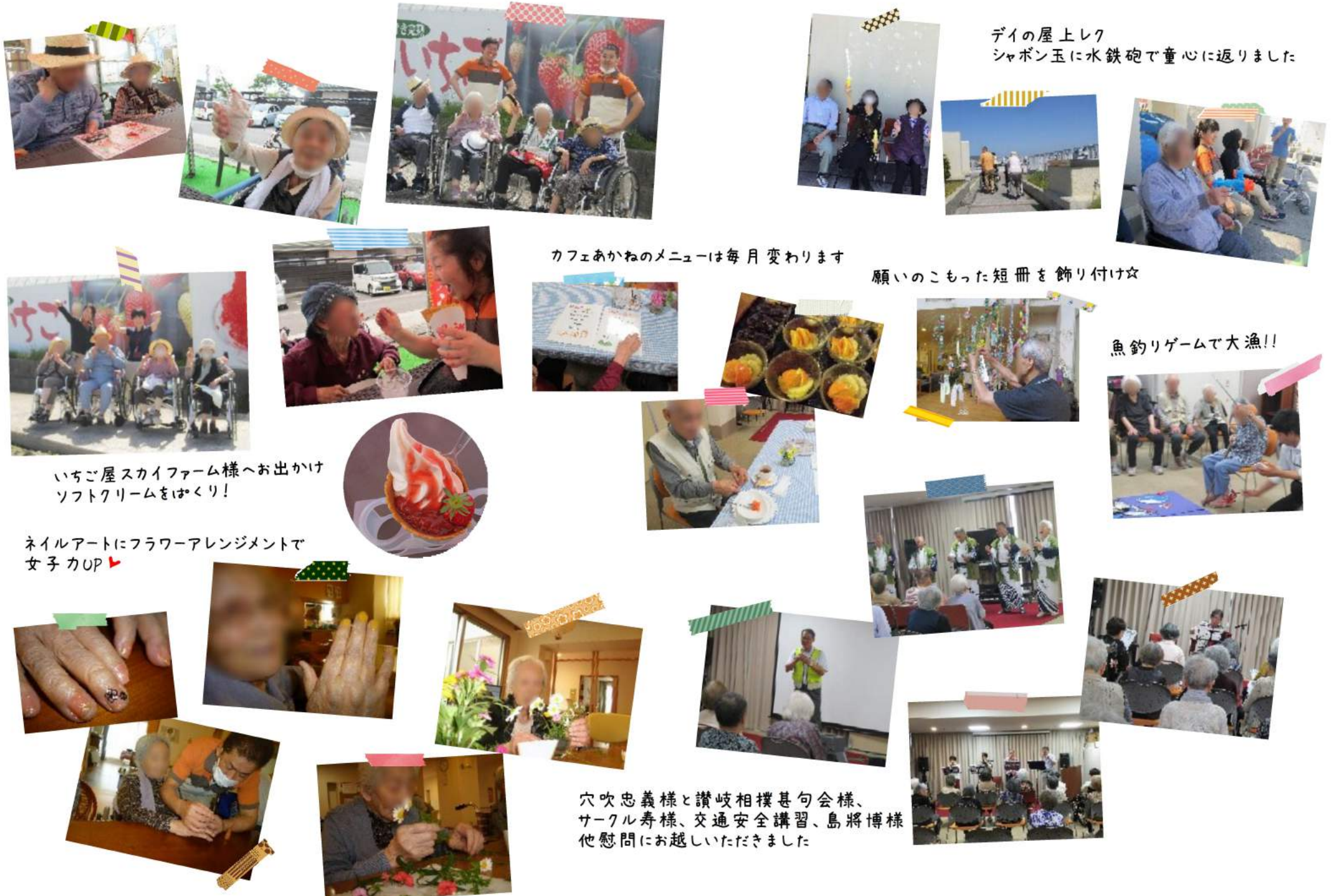
デイの屋上レク シャボン玉に水鉄砲で童心に返りました