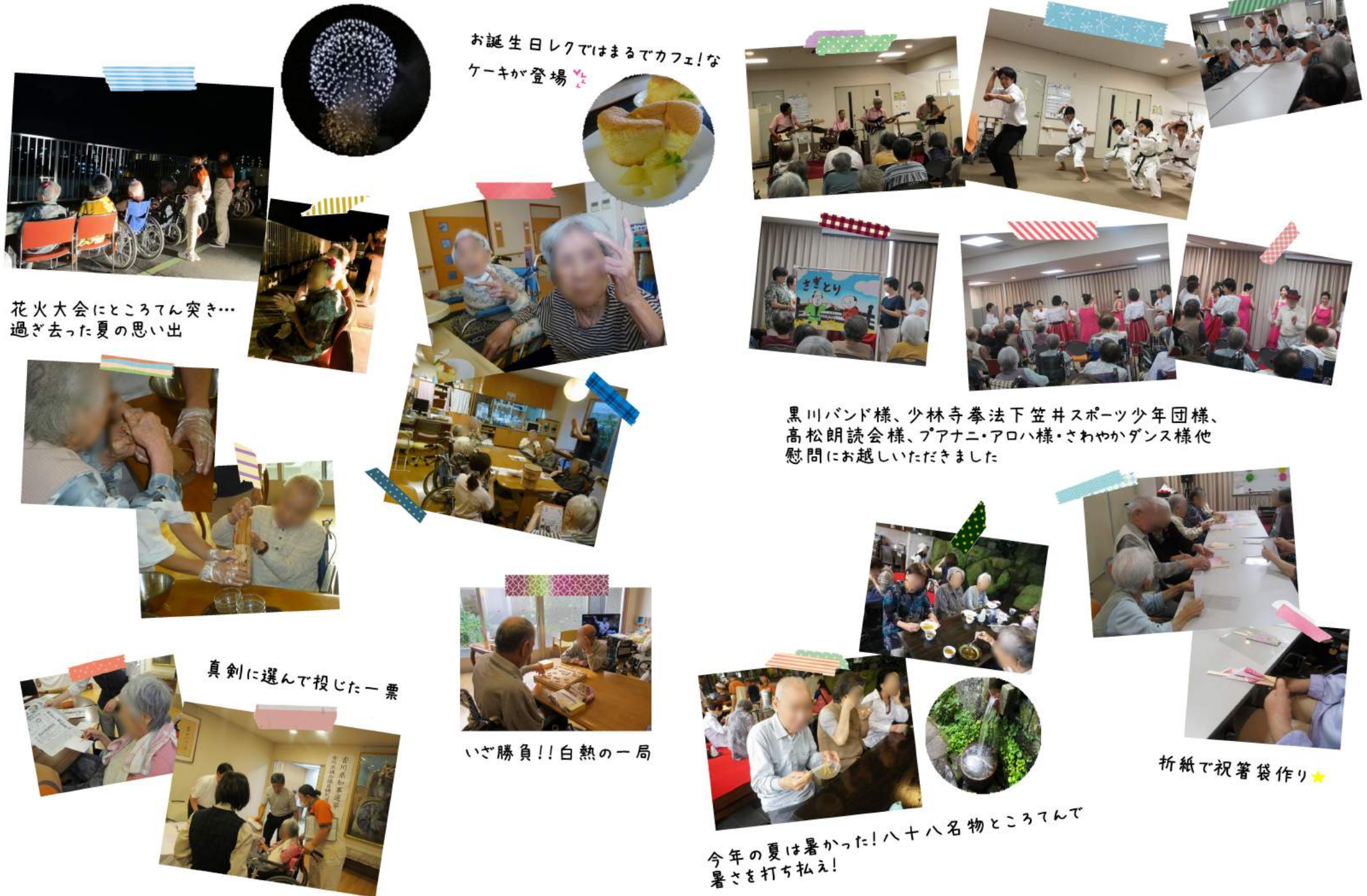
花火大会にところてん突き… 過ぎ去った夏の思い出

平成30年度前半～後半に行われたイベント、レクリエーションの一部をご紹介します。