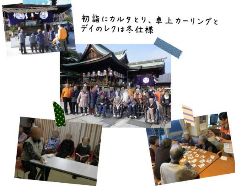
初詣にカルタとり、卓上カーリングと デいのレクは冬仕様