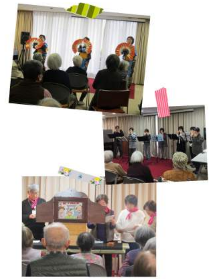
百合友の会様、サークル寿様、 高松朗読会様他、 慰問にお越しいただきました