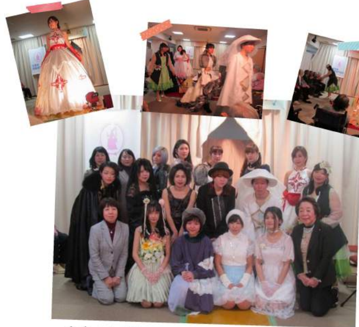
今年もお越しいただきました、 吉田愛服飾専門学校様のファッションショー