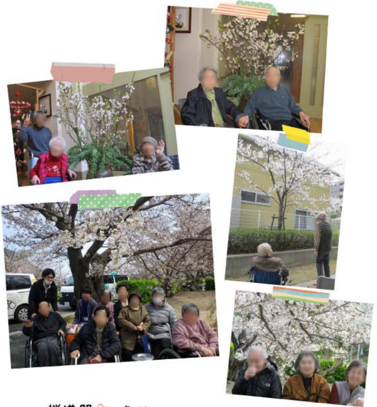
桜満開、各所でお花見を楽しみました