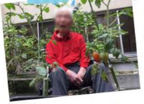
まだまだトマトは青い!?