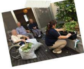
ベランダガーデニング プチトマトを育てましょう～