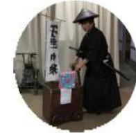
初慰問の栄吉様は本格的なマジックに歌に、 ご利用者様を巻き込んだ寸劇にと盛りだくさんの 1時間で楽しませていただきました