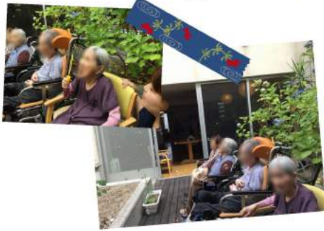
ベランダでシャボン玉レク 屋根まで飛ぶシャボン玉を見て童心に返りました