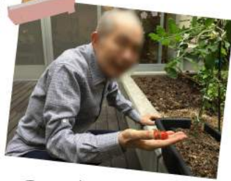
ついに収穫 おいしくいただきました♡