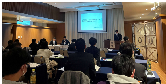
香川県老施協研究大会にて

あかねでは、利用者様の見守りやケアの質の向上、職員の働きやすい 職場づくりのためにICT（情報通信技術）機器を導入しており、そのICT 活用の取り組みについて発表しました。 多くの方に聴講していただき、取り組みに関心を持って頂くことができ ました。介護ICTの普及に貢献し、利用者様がより安心して過ごせる環 境が整えばと思っています。