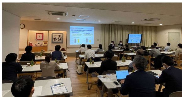
徳島県老施協様 見学研修