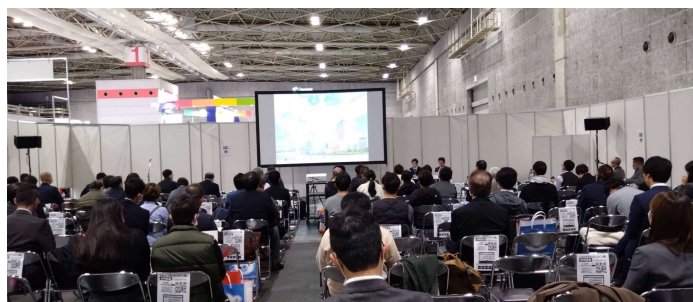
大阪ケアテックスにて